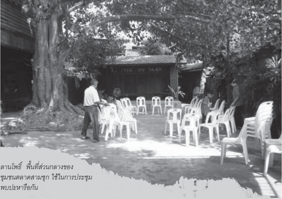
ลานโพธิ์ พื้นที่ส่วนกลางของ ชุมชนตลาดสามชุก ใช้ในการประชุม พบปะหารือกัน

เครื่องมือหล่อลื่นให้การสนับสนุนกิจการของชุมชนได้ ที่สำคัญ ผู้บริหาร เทศบาลมาจากการเลือกตั้ง และมีระบบการบริหารงานที่เป็นอิสระ