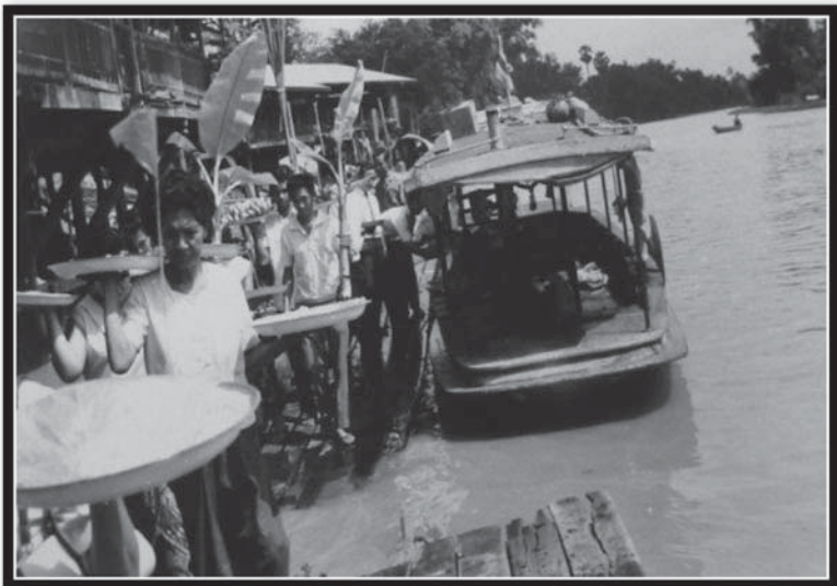
งานทอดกฐินทางน้ำในอดีต ความผูกพัน ผู้คน ศาสนา แม่น้ำ และตลาดสามชุก