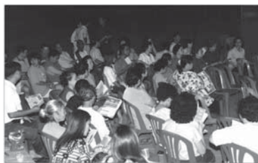
เวทีระดมความคิดเห็นเกี่ยวกับการอนุรักษ์ตลาดสามชุกเมื่อปี 2545