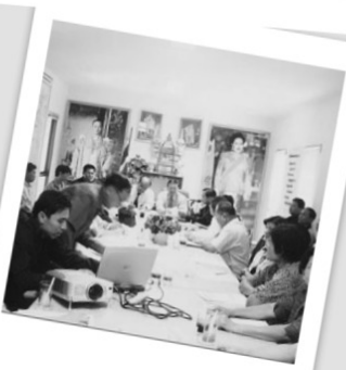
ทีมอนุรักษ์ศิลปกรรม