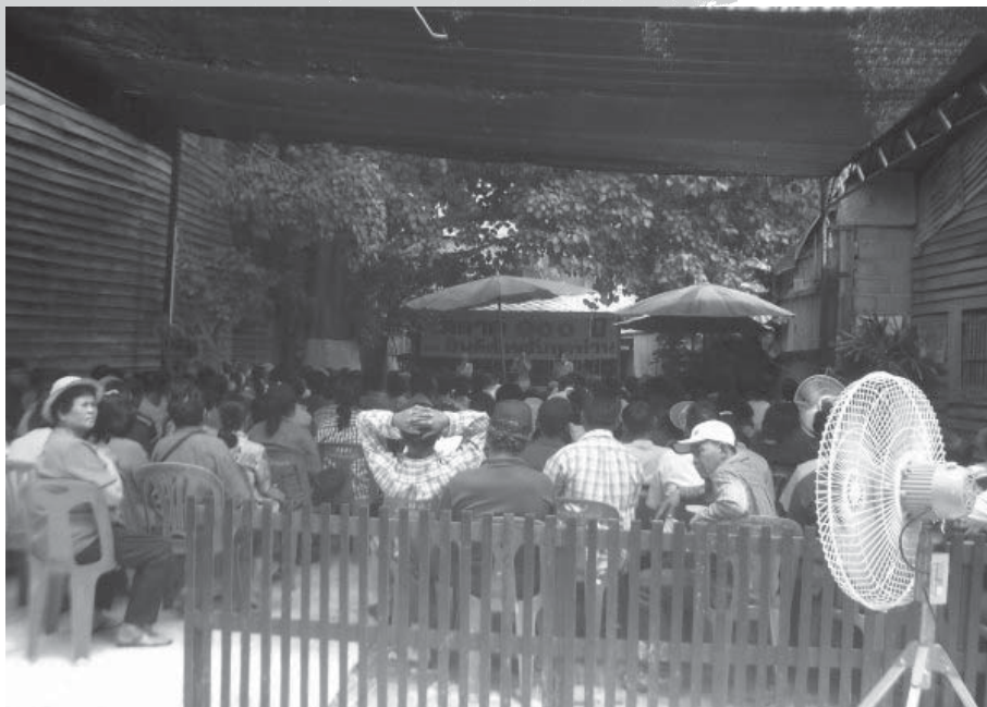
กว่าจะมาเป็นสามยุคในวันนี้ ทั้งคณะกรรมการฯ และชาวบ้านต่างก็มาร่วมประชุมแสดงความคิดเห็นกันหลายครั้งหลายหน