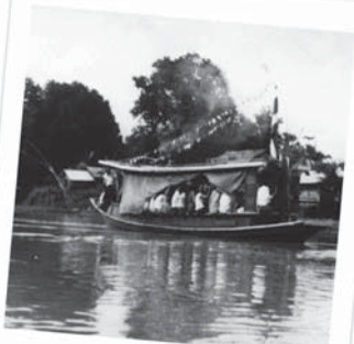
การใช้เรือสัญจรทางน้ำในแม่น้ำท่าจีนในอดีต

จากโคลงนิราศสุพรรณของสุนทรภู่ นิทานย่านสุพรรณ และบันทึกคนรุ่นเก่า จับความได้ว่า “สามชุก” ในอดีตเป็นแหล่งรวมของการแลกเปลี่ยนสินค้า โดยชาวกะเหรี่ยง ลาว ละว้า จะนำเกวียนบรรทุกของป่ามาแลกเปลี่ยนสินค้าที่ชาวเรือนำมาจากทางใต้ ทำให้บริเวณทำน้ำกลายเป็นตลาด มีเรือมาจอดมากมายเพื่อรับส่งสินค้า และสินค้าที่ชาวบ้านนำมานั้น บรรจุกุอยู่ใน “กระชุก” ซึ่งทำจากไม้ไผ่ จึงเป็นที่มาของชื่อ “สามชุก”