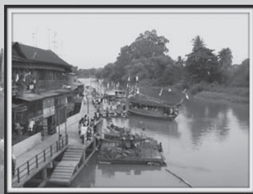
การฟื้นฟูประเพณีการทอดกฐินทางน้ำ

เศรษฐกิจของตลาดจึงดีขึ้นดีคืน มีการเปลี่ยนแปลงในย่านตลาดที่สำคัญคือ ด้านความสัมพันธ์ที่มีระหว่างกัน คณะกรรมการฯ ต่างรู้สึกประทับใจกับ “น้ำใสไมตรีที่มีต่อกันมากขึ้นของคนย่านตลาด มีการทักทายปราศรัยยิ้มแย้มให้แก่คณะกรรมการฯ อย่างที่ไม่เคยเป็นมาก่อน”