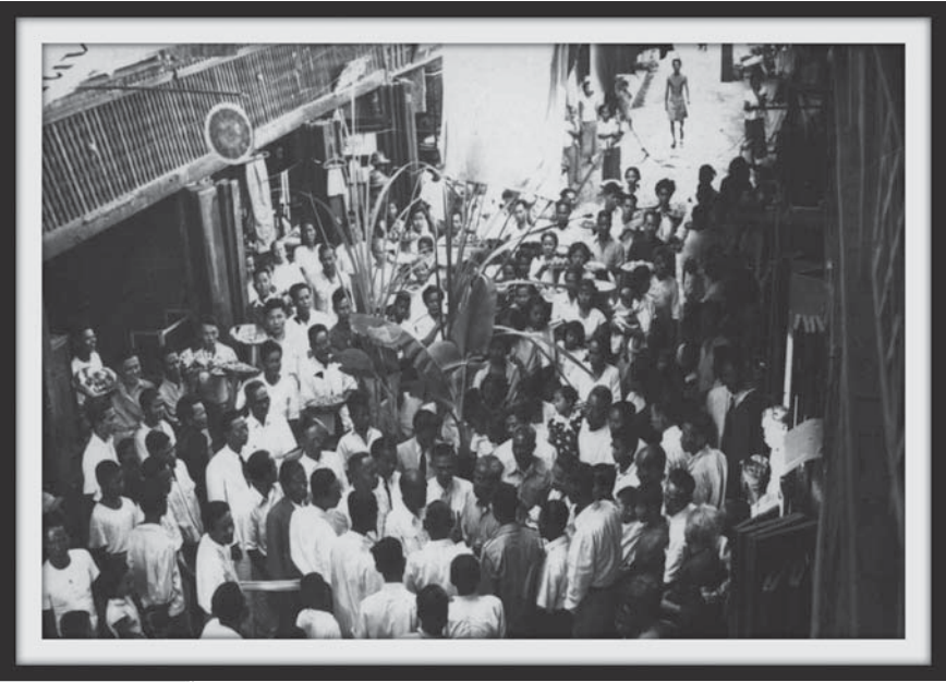
งานบุญในตลาดสามชุกในอดีต

อีกชื่อหนึ่งที่เรียกขานพื้นที่นี้คือ “สามเพ็ง” ซึ่งเล่ากันว่าเพี้ยนมาจาก “สามแพ่ง” เนื่องจากเป็นที่ชุมนุมของพ่อค้าที่เดินทางมาจากทิศเหนือใต้ และตะวันตก