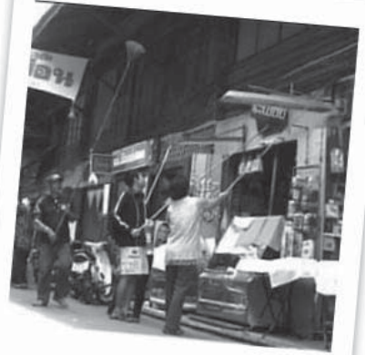
ภาพการทำกิจกรรมกวาดหยากไย่แมงมุมที่ตลาดวอริชชัย เป็นกิจกรรมแรกที่คนในตลาดร่วมกันทำเพื่อฟื้นฟูตลาด

แนวคิดในการดำเนินการของคณะกรรมการพัฒนาตลาดสามชุก เริ่มเปลี่ยนไป เมื่อมูลนิธิชุมชนไทเข้ามาร่วมดำเนินการเมื่อปลายปี พ.ศ. 2545 โดยมีหลักการที่เริ่มจากการมีส่วนร่วมของชาวชุมชน และการพัฒนาอย่างเป็นองค์รวม โดยสรุปกระบวนการที่สำคัญ ดังนี้