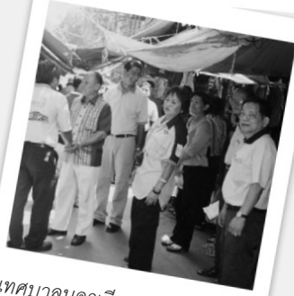
เทศบาลนครเชียงใหม่รายมาศึกษางาน

อย่างมาก คือกระบวนการ “ปลูกบ้าน” ให้กลายเป็น “พิพิธภัณฑ์ชุมชน” โดยได้แนวคิดแรงบันดาลใจมาจากการไปแลกเปลี่ยนดูงานตามที่ต่างๆ