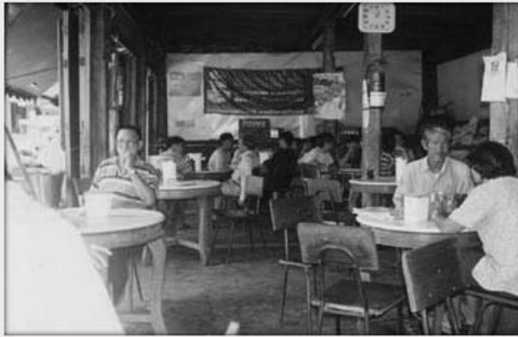
ร้านกาแฟเก่าแก่ดั้งเดิม

ที่สามชุก ทั้งหมดทั้งปวงเหล่านี้ เริ่มขึ้นจากกลุ่มเล็กๆ ในแต่ละส่วนของสังคมนุชน โดยเริ่มต้นที่คณะกรรมการชุมชน คณะกรรมการพัฒนาตลาดสามชุก ชาวตลาด วัด โรงเรียน และเยาวชนในเขตสามชุก แล้วขยายไปสู่ภาคีและชุมชนอื่นๆ ทั้งที่เป็นนักวิชาการ ข้าราชการและองค์กรหน่วยงานรัฐ และเอกชนภายนอก