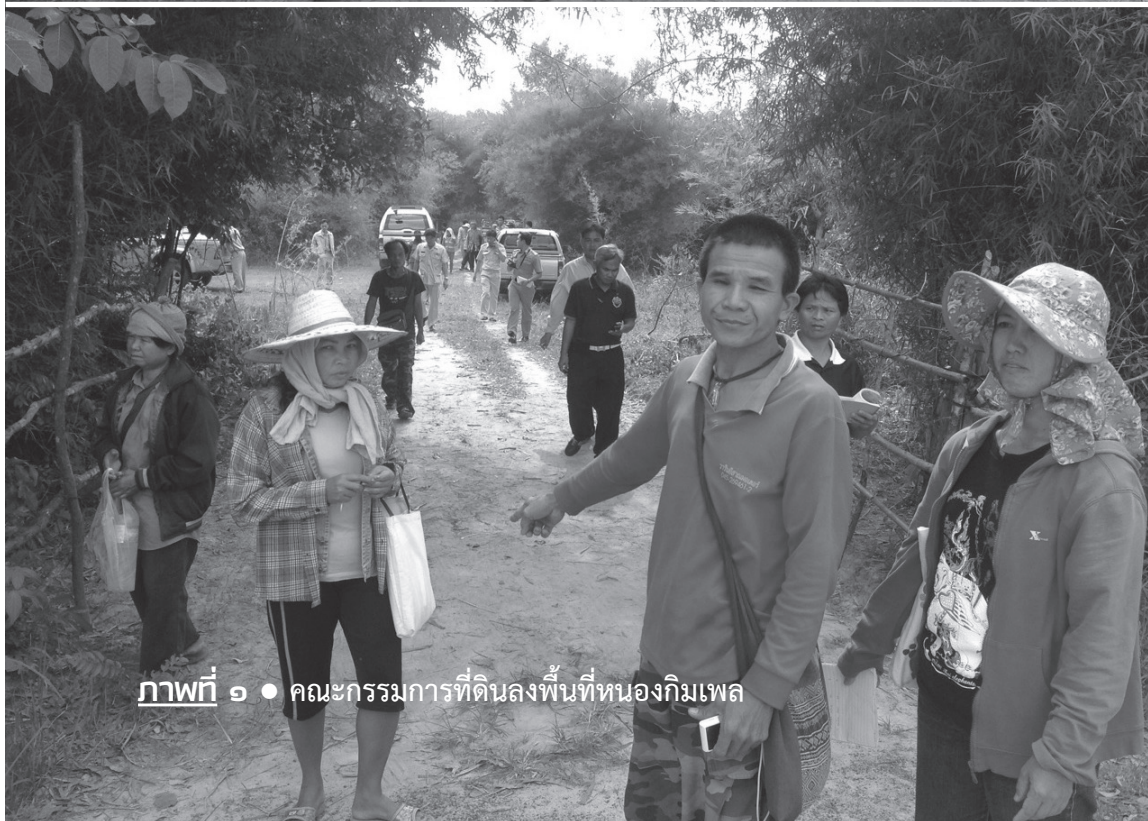
ภาพที่ ๑ • คณะกรรมการที่ดินลงพื้นที่หนองกิมเพล