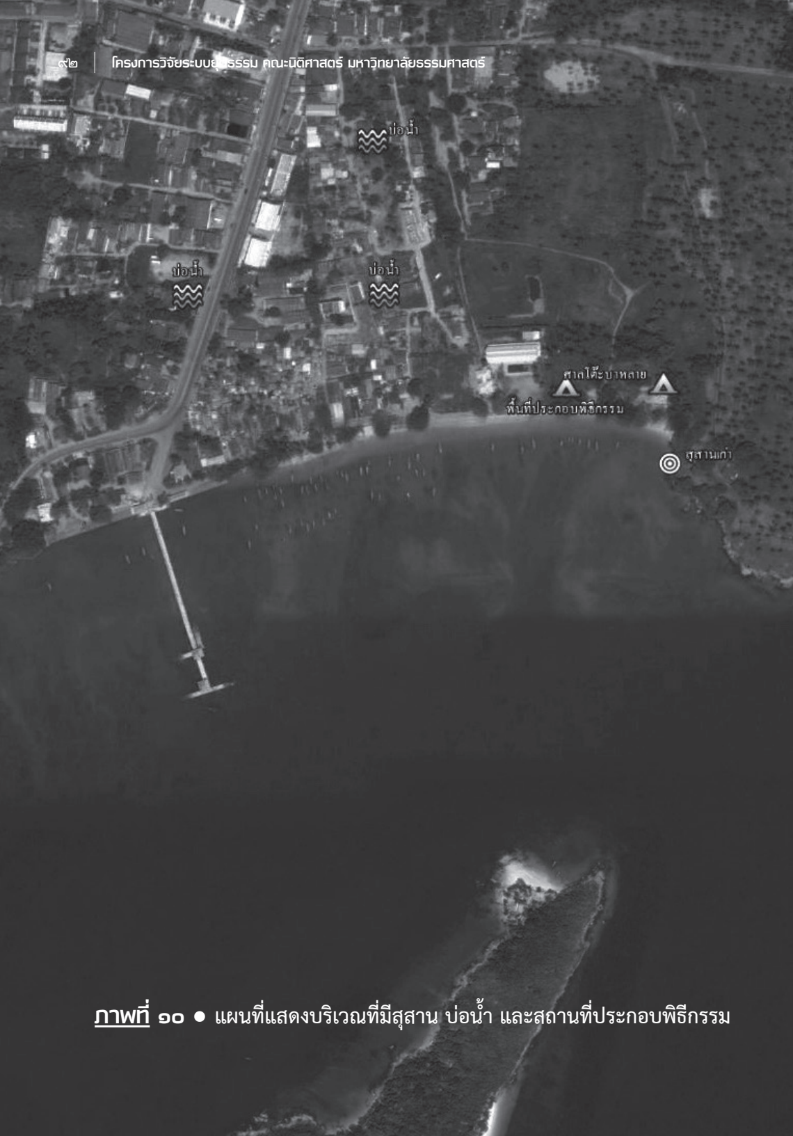
ภาพที่ ๑๐ • แผนที่แสดงบริเวณที่มีสุสาน บ่อน้ำ และสถานที่ประกอบพิธีกรรม