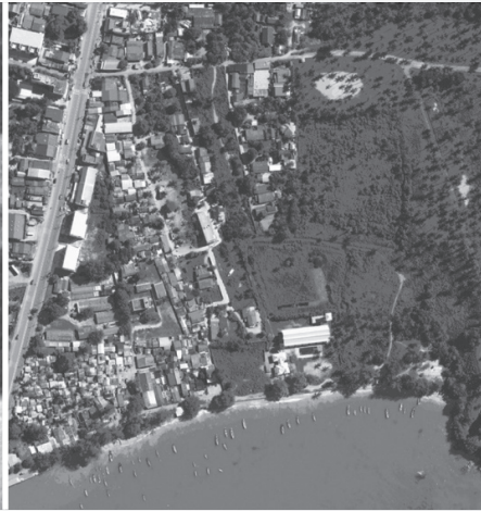
ภาพที่ ๑๓ • แผนที่ทางอากาศ ปี พ.ศ.๒๕๑๐