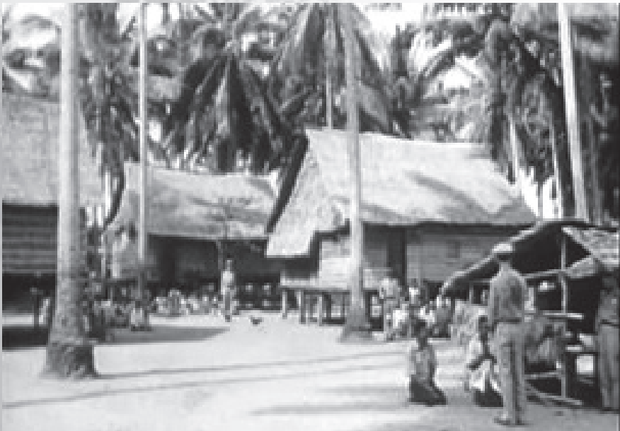
ภาพที่ ๑๒ ● พระบาทสมเด็จพระเจ้าอยู่หัวเสด็จพระราชดำเนินเยี่ยมราษฎรที่หาดราไวย์

พัฒนาการของชาวเลในปัจจุบันจึงเกิดขึ้นมาพร้อมๆ กับความเป็นภูเก็ต โดยยืนยันจากข้อมูลที่ชาวตะวันตกเดินทางเข้ามาและพบเห็นกลุ่มคนเหล่านี้และเรียกกลุ่มคนเหล่านี้ว่า ชาวน้ำ และสอดคล้องกับแนวคิดของชาวเลในปัจจุบัน ต่อเรื่องการไม่ยึดเอาทรัพย์สินมาสะสมเป็นสมบัติส่วนตัว การเดินทางร่อนเร่ไปตามท้องทะเลรอบๆ เกาะแก่งต่างๆ แต่ก็มีร่องรอยซึ่งแสดงให้เห็นถึงสภาพที่อยู่ที่เป็นจริงในอดีต